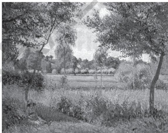
Dimineață la Éragny, Camille Pissarro

Adormind de armonia Codrului bătut de gânduri, Flori de tei deasupra noastră Or să cadă rânduri-rânduri.